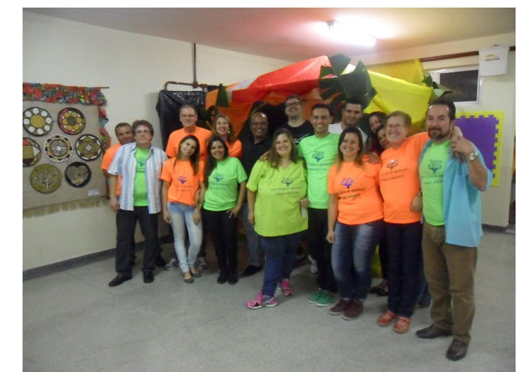
Equipe CPFP Júlio de Grammont