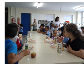
Famílias registram suas impressões sobre a Mostra Cultural 2014 e participam das ações realizadas no Projeto XEQUEMÁTICA.