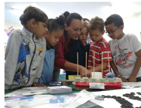
Famílias e crianças interagem brincando, jogando, divertindo e aprendendo matemática.