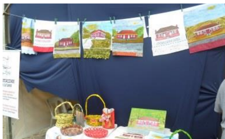
Apresentação dos cursos de artesanato