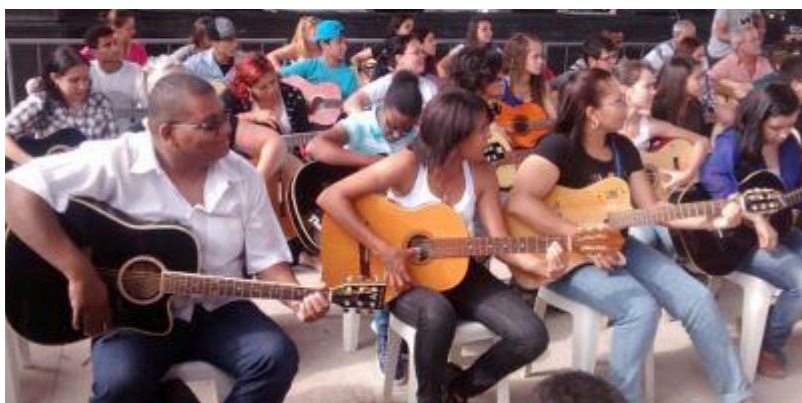
Apresentação dos cursos de violão

“Mobilização Social pela Educação”: 29/11/2014 No Parque Central Centro Comunitário participando desta ação!