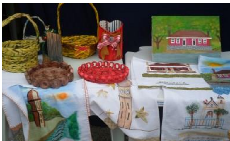
Apresentação dos cursos de artesanato