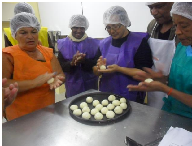
Curso de Alimentação: mãos na massa!