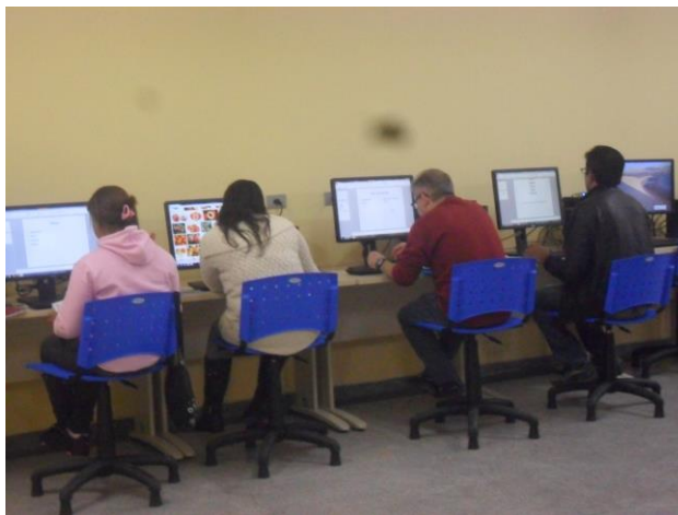
Curso de Informática: inclusão digital

“Clara manhã, obrigado. O essencial é viver.”