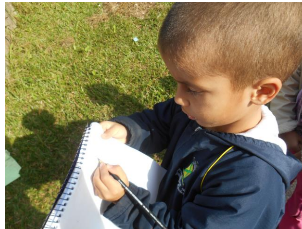
Crianças andam pela vizinhança e registram