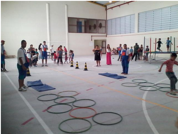
Atividades de recreação com o Expresso Lazer