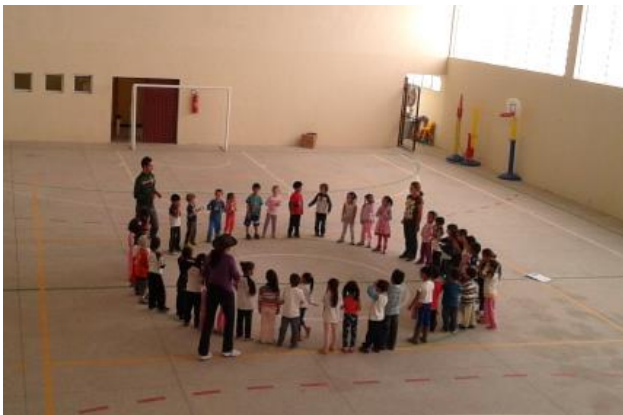
Roda cantada: resgate da cultura popular