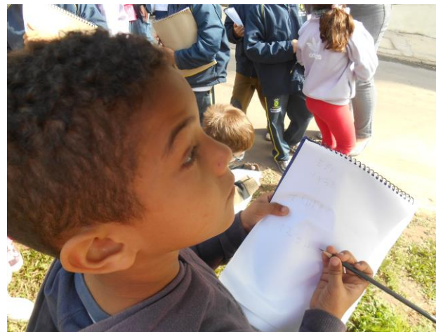
Observação na comunidade e anotação da presença dos números no dia a dia